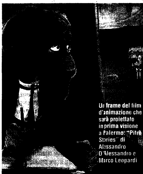
Un frame del film d'animazione che sarà proiettato in prima visione a Palermo: "Pitrè Stories" di Alessandro D'Alessandro e Marco Leopardi

Parte lunedì a Palermo il Sole Luna Festival dedicato ai film documentario. Tra gli ospiti internazionali il regista Julian Temple che presenterà la sua pellicola sui Sex Pistols